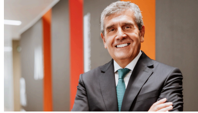
Manuel López Donaire Presidente de Delaviuda Confectionery Group

Actualmente participa en consejos de administración de grandes compañías internacionales y es una figura destacada en el ámbito empresarial e institucional español, habiendo presidido organizaciones como el Círculo de Empresarios y SECOT.